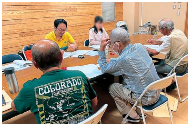
学生を連れての方言調査

その他、日本文学研究室、日本語学研究室、日本語教育研究室、日本思想史研究室でも、それぞれ水俣市、八代市、人吉市、天草市、小国町などで調査・研究を行っています。年度によっては「複合演習」という授業で熊本博物館が所蔵する和本整理に当たることもあり、積極的な学生は2つ3つと掛け持ちして、他では味わえないような学生生活を満喫しています。