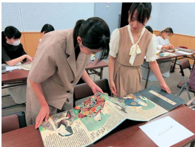
熊本博物館での和本調査

机に向かって本を読むことだけが、大学の勉強ではありません。 地域との積極的なかわりの中で、「生きた知識」の構築を目指します。