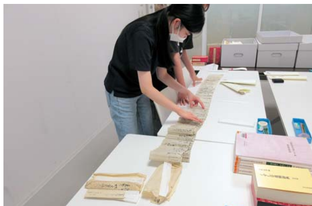
菊池市での和本・古文書調査