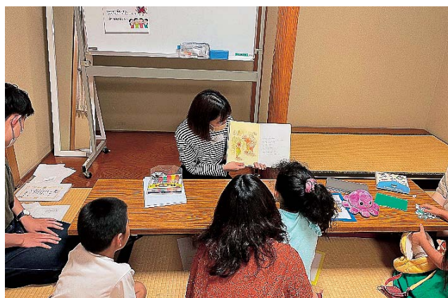
おるがったキッズ

「おるがったキッズ」は外国にルーツのある子ども(5歳~8歳)を対象とした地域の日本語教室です。この教室は熊本県立大学、NPO法人外国から来た子ども支援ネットくまもと、熊本市国際交流振興事業団、熊本保健科学大学が共同で運営しており、本学からは教員と学生(日本語教員養成課程の受講者)が活動の一部を担当しています。