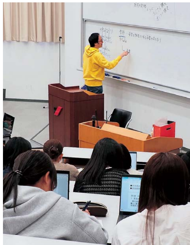
授業風景(日本語学概論Ⅰ)

ことばには決まりや約束ごとがあります。それがあからこそ会話が成り立つのですし、自分の知らないことばについては、その決まりを知らないからこそ理解したり使ったりすることができません。ことばの中でも主に現代日本語を扱うわけですが、一口に日本語と言っても様々で、いわゆる標準語と方言では異なった決まりがあったりします。そのような決まりや法則性を探ってみるのはとても面白いことです。例えば、ドアを開める音を表すのに「パタン」と「パタン」では前者のほうが荒々しい閉め方をした印象を持ちます(『音象徴』と呼ばれる分野)。九州の多くの方言で、質問するとき「今日、来ると?」とは言っても、「これ、ラーメンと?」と言うのには抵抗を持つ人が多いです(方言における疑問の「と」の使い方)。日本語を使うとき、知らず知らずのうちに何らかの決まりにしたがっているわけです。このような、ことばに関する決まりに興味を持って、解き明かしてみたいと思う学生さんは是非お越しください。